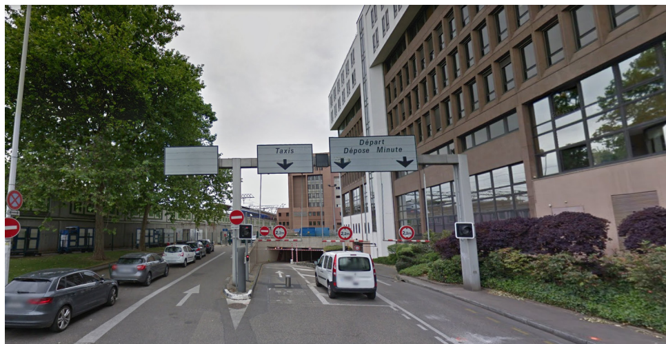
Ancien accès taxis / dépose minute