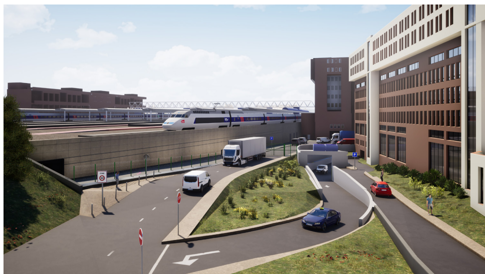
Vue projetée de la sortie Bonnel réservée aux taxis et aux activités logistiques de la gare.