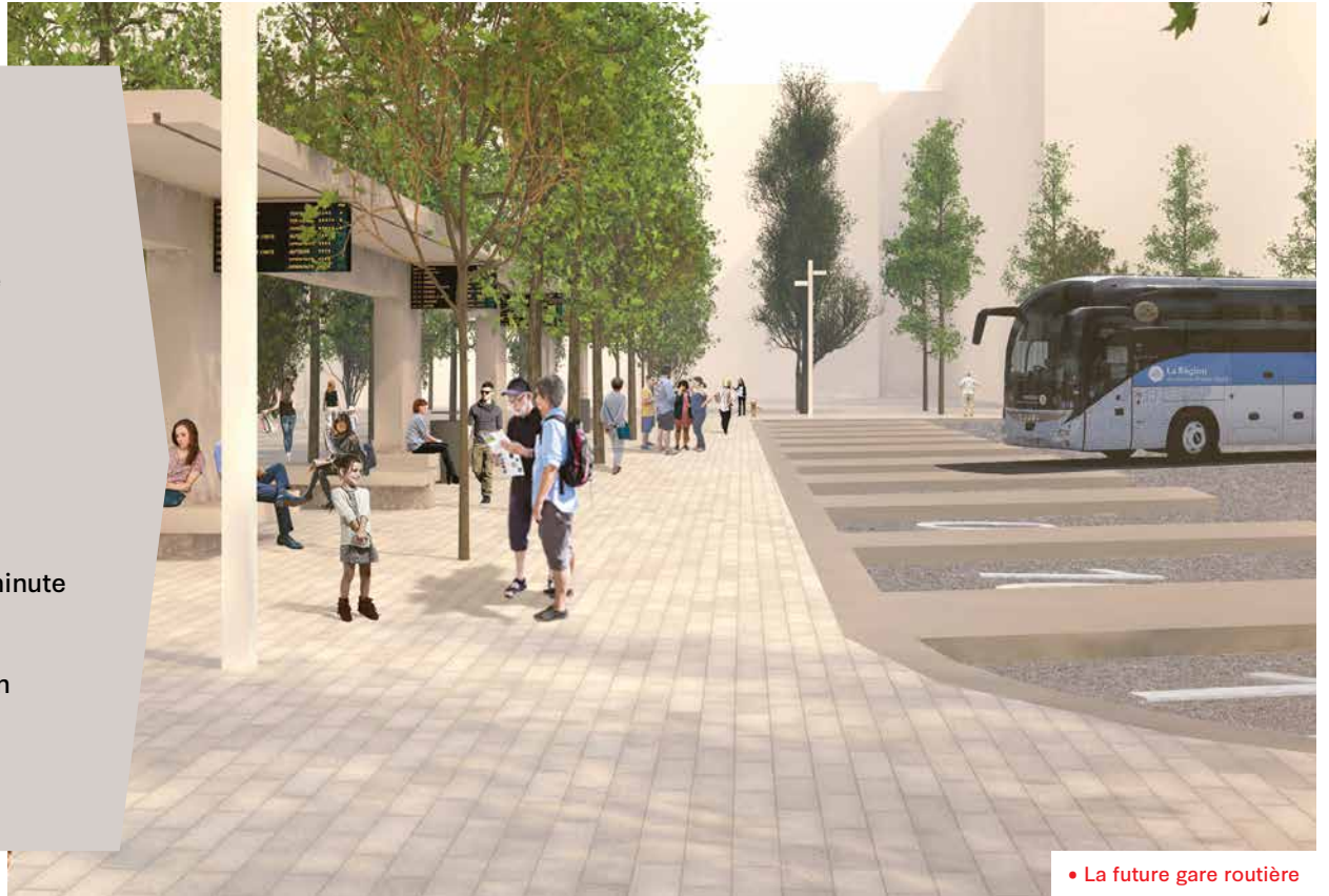
• La future gare routière