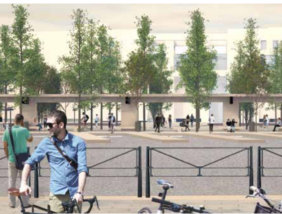
• Vue sur la gare routière depuis la rue Flandrin

Entre la rue d'Aubigny et l'avenue Pompidou, vitesse limitée à 30 km/h pour accueillir une piste cyclable en contresens et faciliter l'accès des cars à la gare routière. D'octobre à mai, circulation en sens unique (nord-sud). En juin 2018, mise à double sens pour améliorer la circulation. Passages piétons redessinés pour faciliter la traversée de la chaussée.