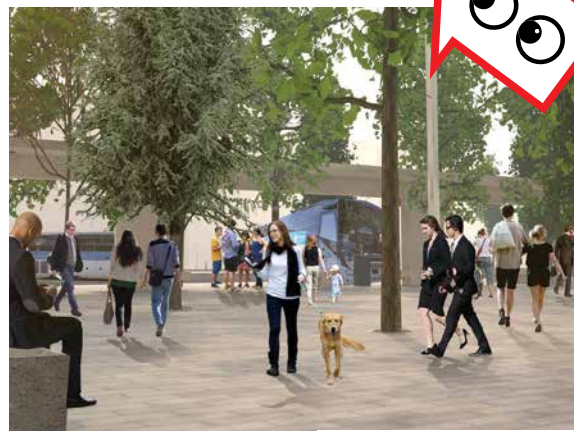
• L'espace piéton arboré