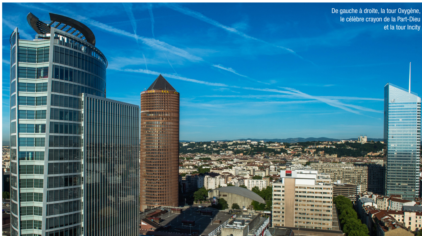
De gauche à droite, la tour Oxygène, le célèbre crayon de la Part-Dieu et la tour Incity