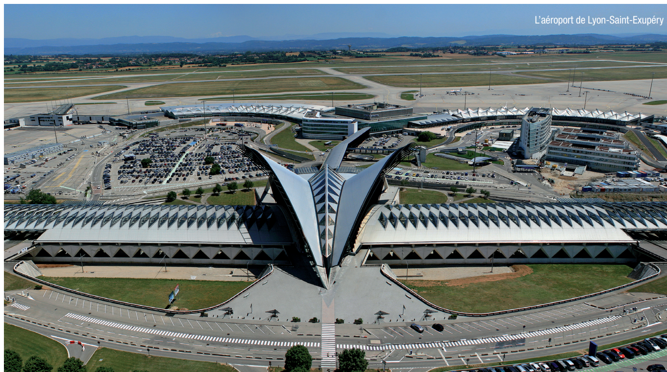
L'aéroport de Lyon-Saint-Exupéry

Rendre la ville intelligente, c'est mettre l'habitant au cœur de la cité en facilitant la ville et donc la vie, plus connectée, avec des services plus intégrés et complémentaires. Il s'agit d'offrir aux habitants des solutions efficaces et durables, en transport notamment. Un grand défi que s'est lancé Lyon, déjà en pointe depuis des années pour développer différents moyens de mobilité et rendre ainsi la ville accessible à tous.