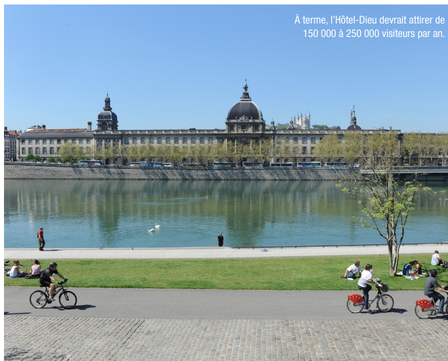
À terme, l'Hôtel-Dieu devrait attirer de 150 000 à 250 000 visiteurs par an.

L'Hôtel-Dieu a pour ambition de devenir une place incontournable de la vie lyonnaise aussi bien pour les habitants que les touristes, avec l'ouverture notamment au public de ses 1 500m 2 de cours intérieurs et jardins, transformés en véritables lieux d'échanges et de détente.